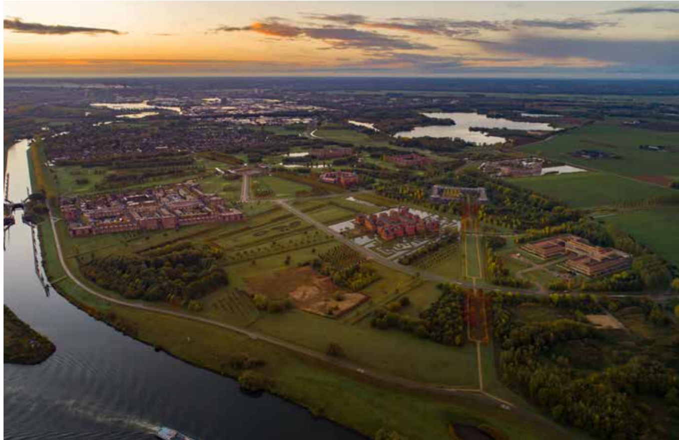
▲ Het spraakmakende nieuwbouwproject Haverleij in Den Bosch, 2022.