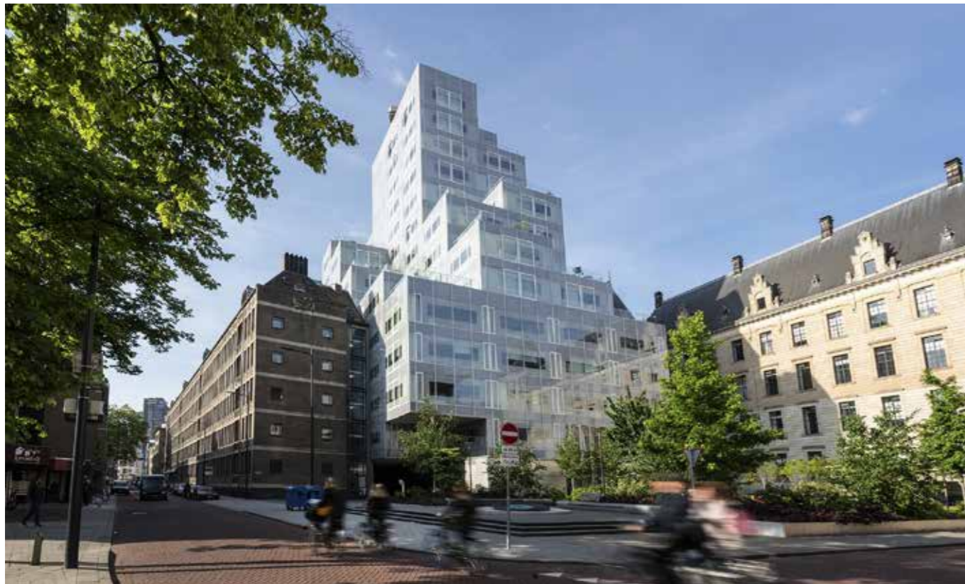
▼ Heijmans bouwt en onderhoudt het Timmerhuis in Rotterdam, 2015.

Zelf doet Heijmans aan maatschappelijk verantwoord ondernemen door CO 2 -neutraal te werken vanaf 2023. Ook heeft het bedrijf een duurzaam inkoopbeleid voor materialen en goederen, recyclet het afvalstromen en werkt het samen met universiteiten en andere organisaties aan verduurzaming. Ook wendt Heijmans zijn invloed aan om ketenpartijen te verleiden tot grotere duurzaamheidsinspanningen. Bovendien leidt Heijmans statushouders op om in het bedrijf te komen werken en zo een nieuwe toekomst in Nederland op te bouwen.