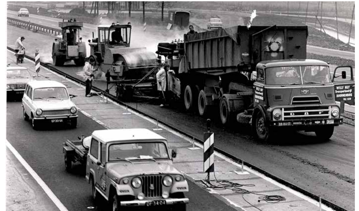
▼ Het asfalteren van een rijksweg in Zoetermeer.