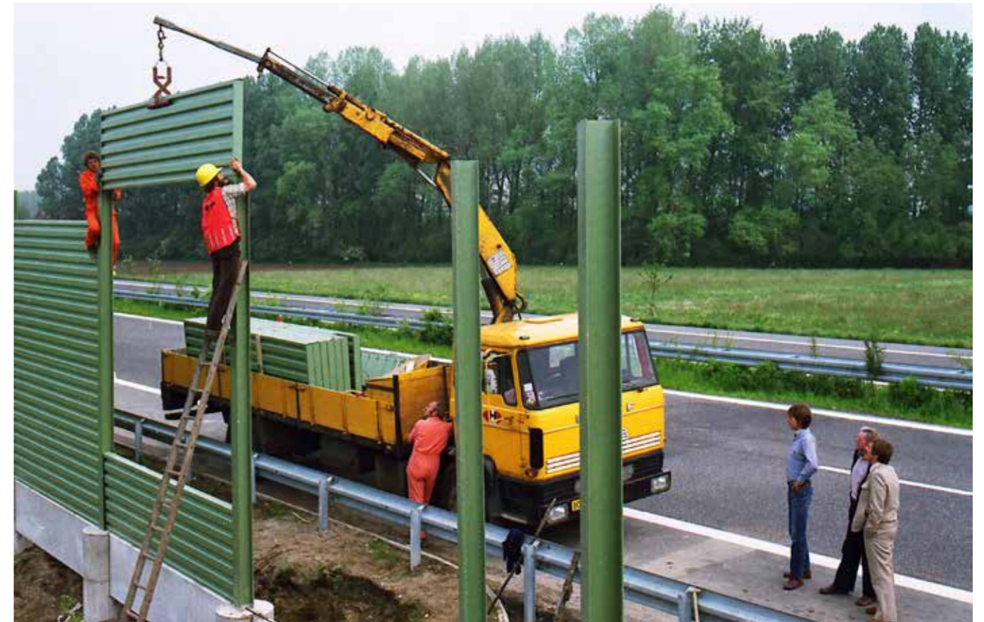
▲ De aanleg van een geluidsscherm in het Duitse Sonsbeck, 1981.

▲ ▲ ▲ De aanleg van werkhaven Schelphoek met asfaltschip Jan Heijmans, 1981.