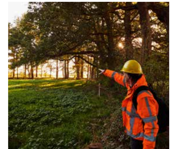
▲ De bouw van Park Vijfsluizen in Vlaardingse, een gebied met natuurinclusieve en energiezuinige woningen, 2021.