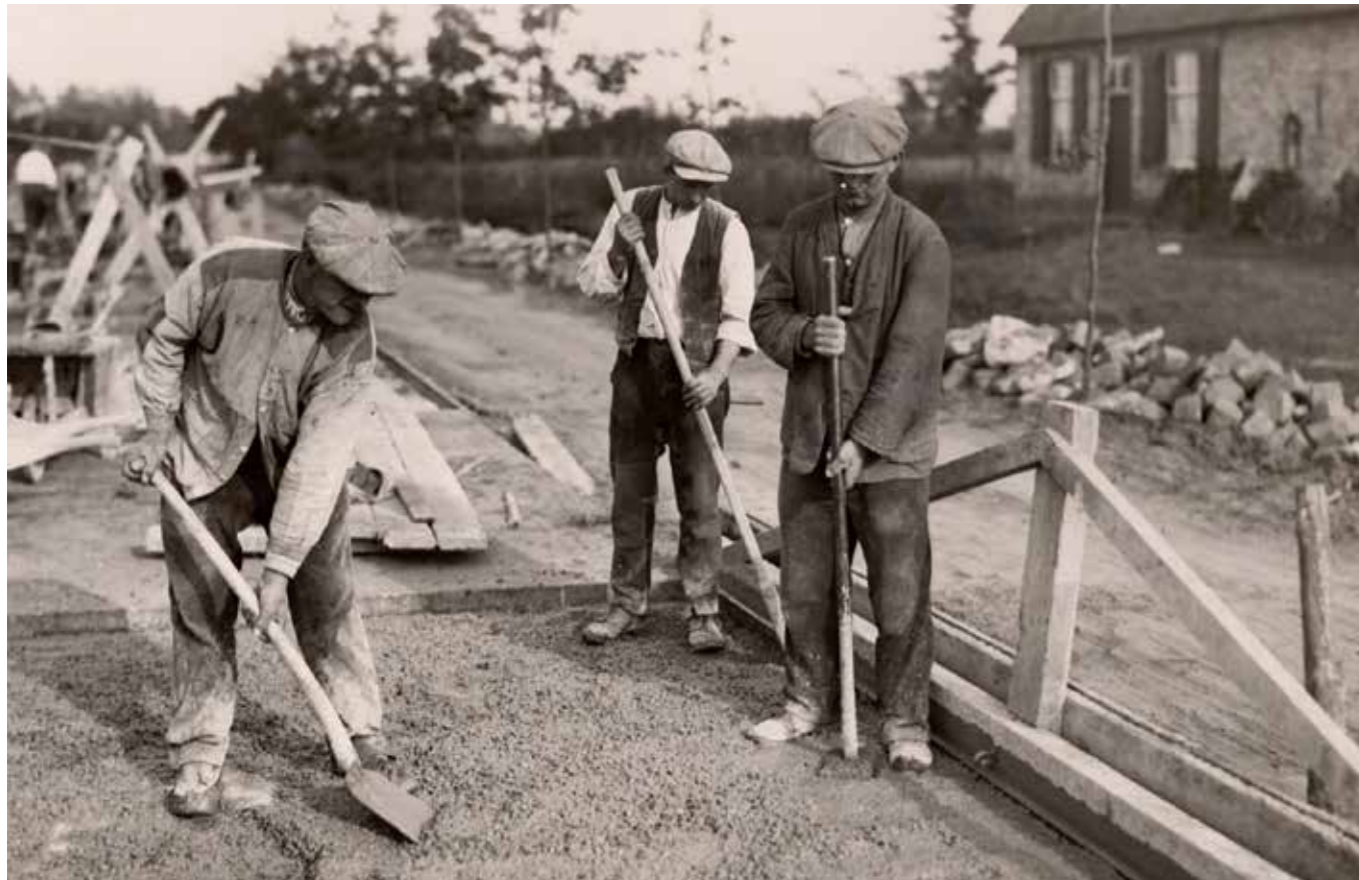
▲ De aanleg van een betonweg Geffen in 1927.